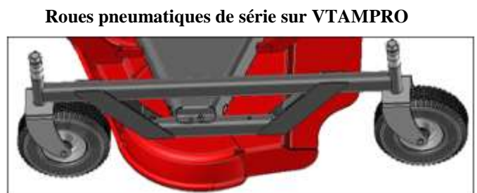
Roues pneumatiques de série sur VTAMPRO