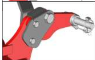
Bras flottants renforcés et rallongés VTAMPRO.