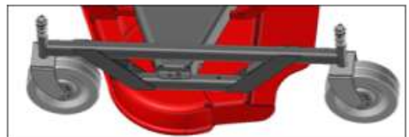
Option roues fer (KROFTAMPRO) pour VTAMPRO