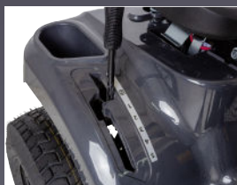
SÉLECTEUR MANUEL 5 VITESSES