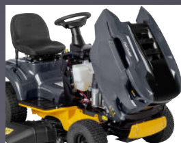
CAPOT MONOBLOC PIVOTANT