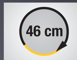
RAYON DE BRAQUAGE COURT