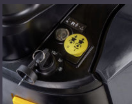
TONTE EN MARCHE ARRIÈRE